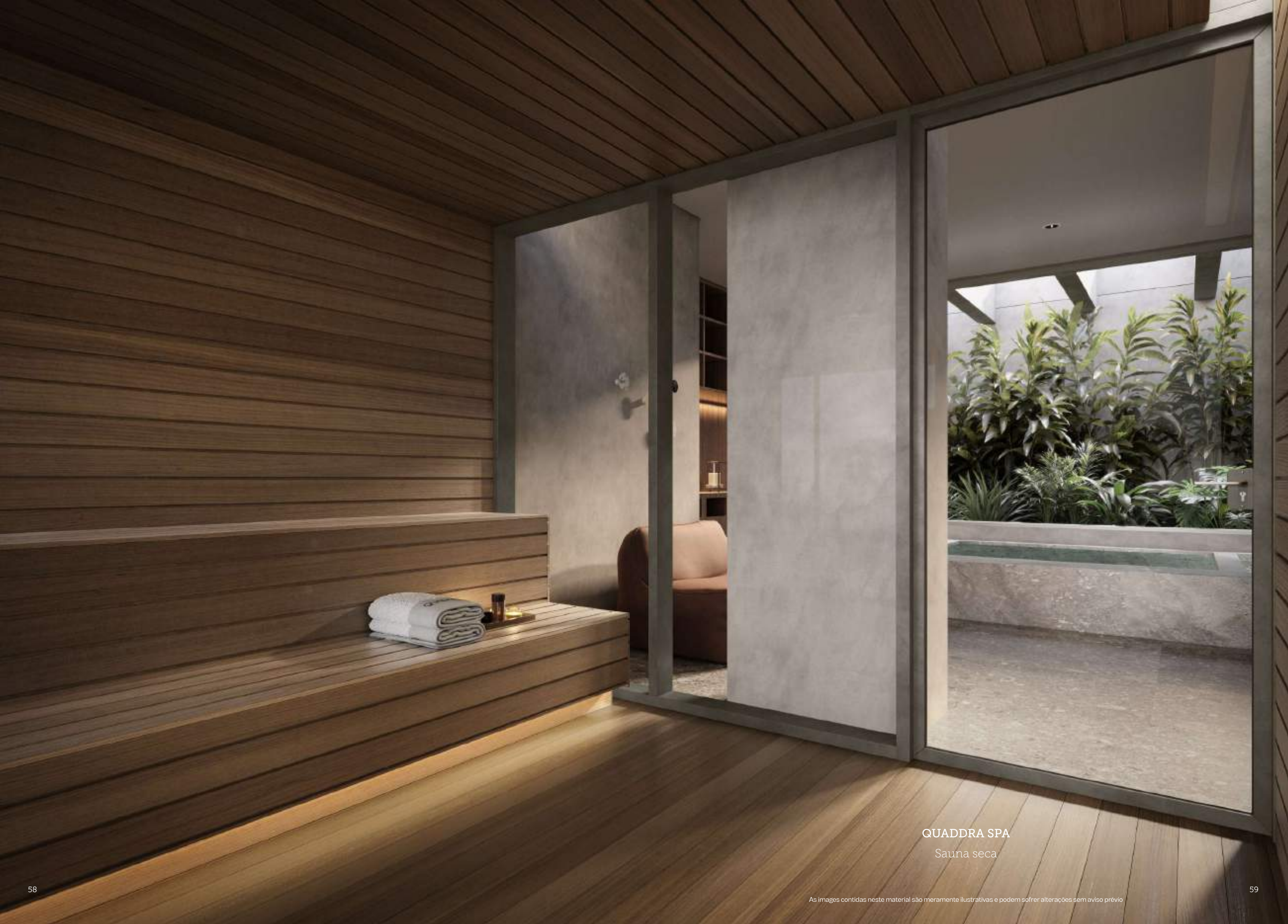
QUADDRA SPA Sauna seca