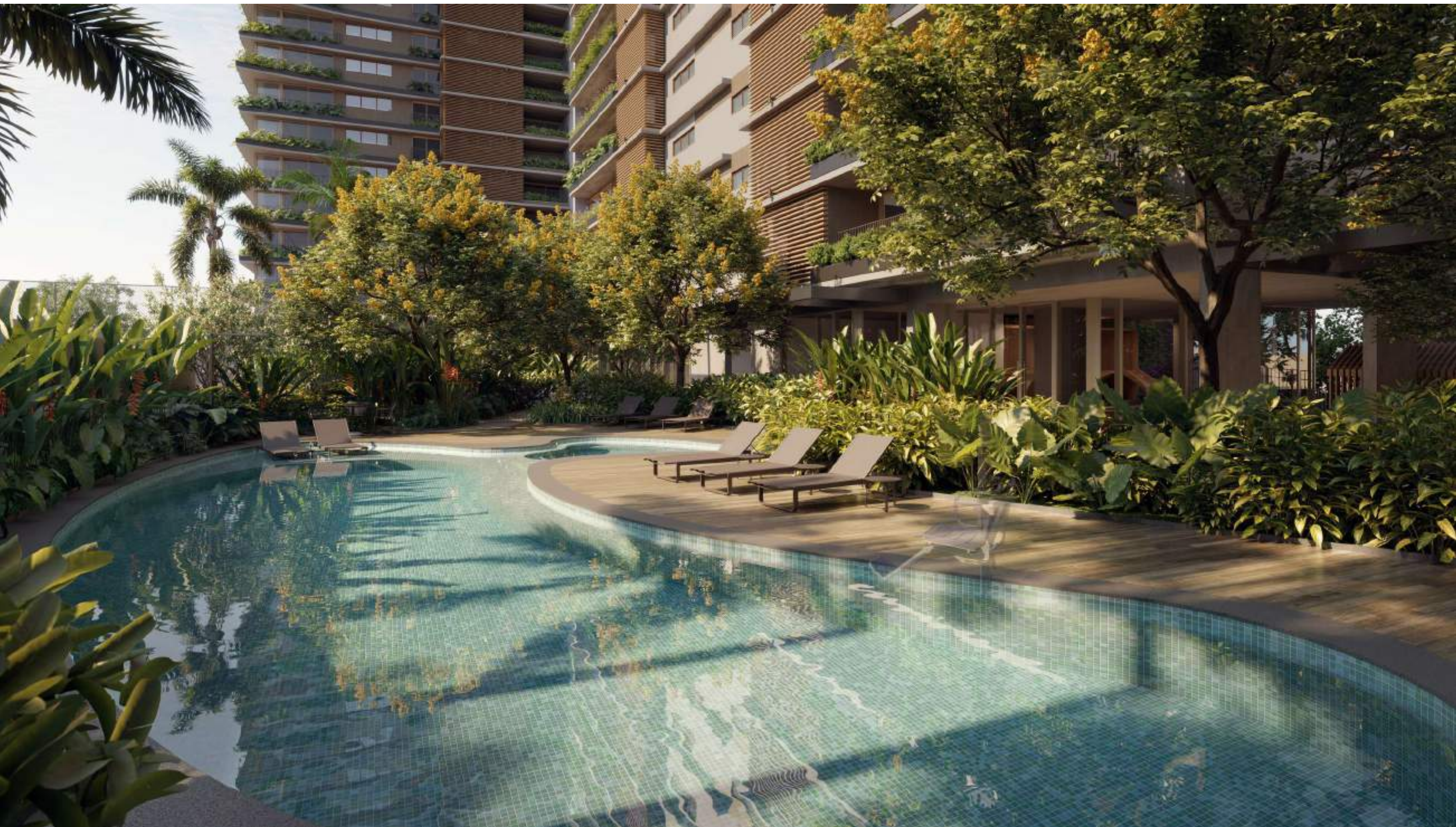
OUTDOOR POOL Design orgânico