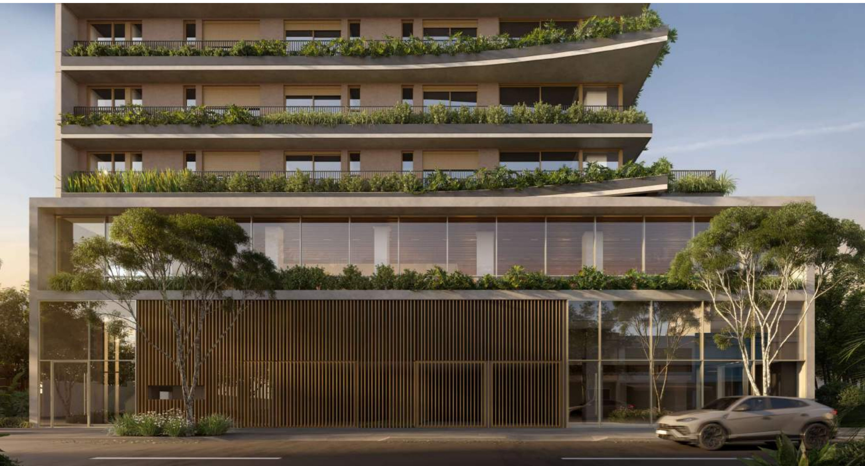
PÓRTICO TORRE PARQUE