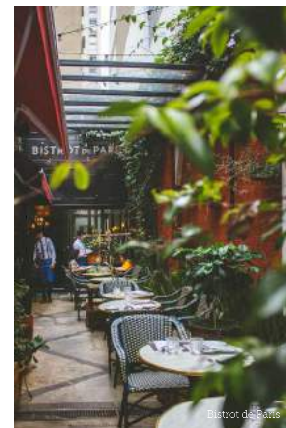
Bistrot de Paris