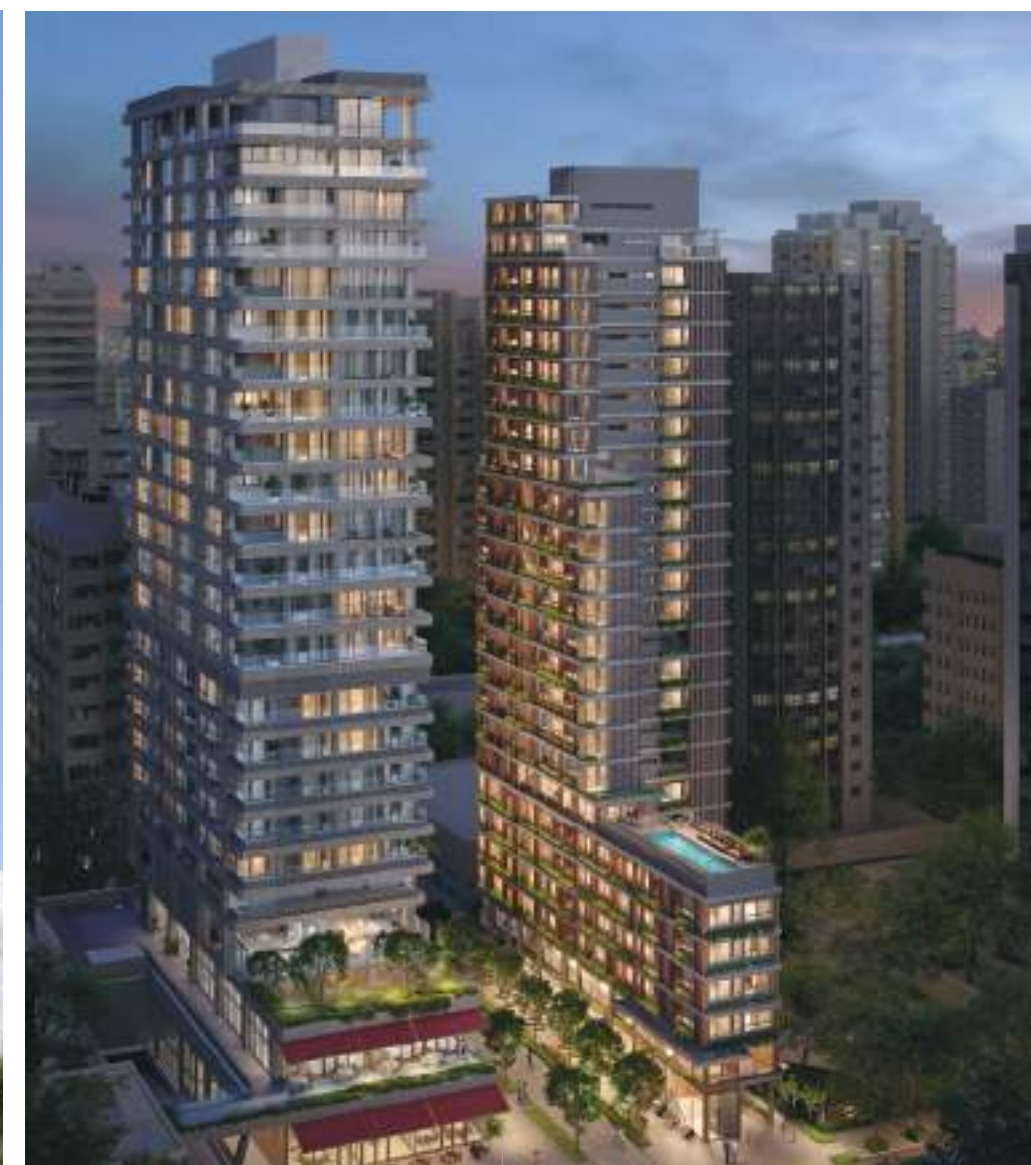
155 E 177 JERÔNIMO