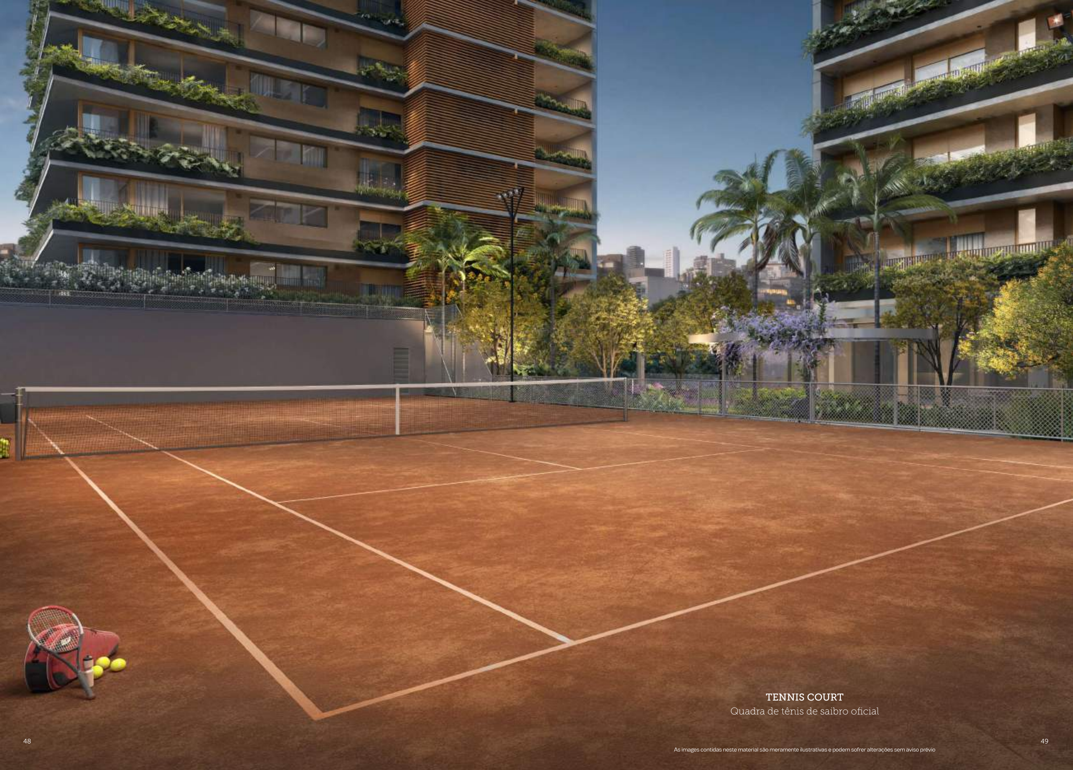
TENNIS COURT Quadra de tênis de saibro oficial