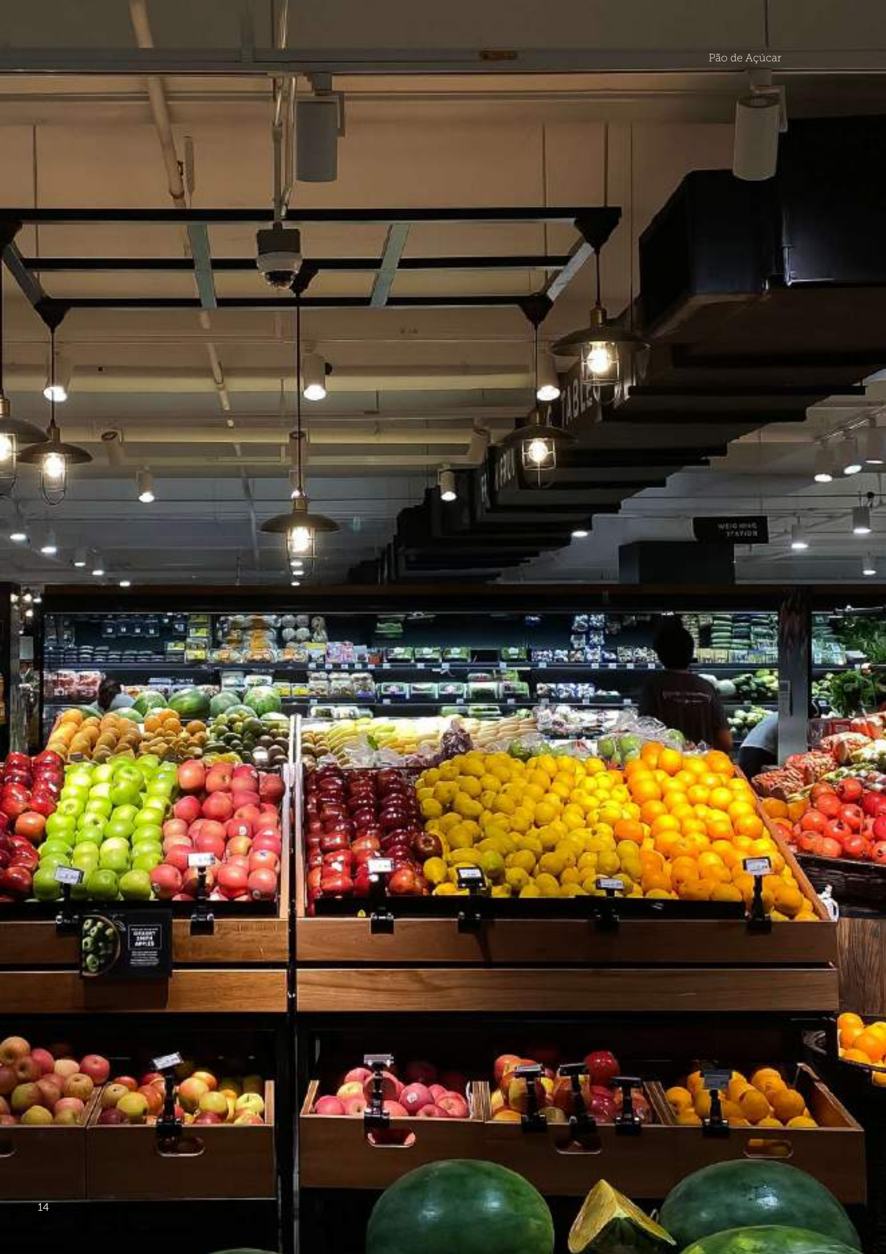
Pão de Açúcar