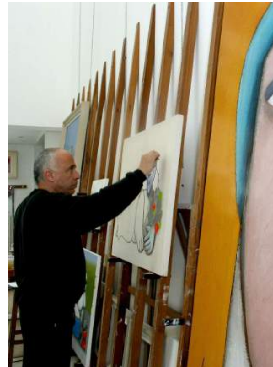
Instituto Gustavo Rosa

Entrar em uma galeria, é abrir uma porta para o inesperado. É aceitar o convite de se perder por instantes e se reencontrar em formas, cores e ideias. É experimentar o bairro por outro ângulo.