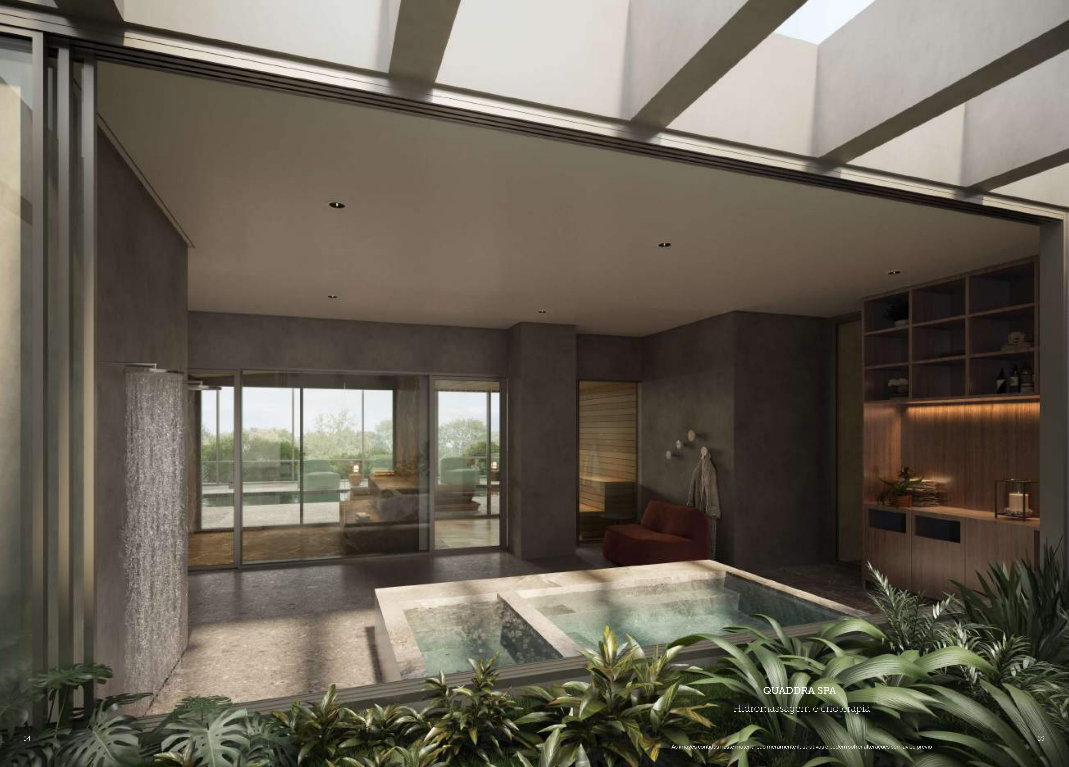
QUADDRA SPA Hidromassagem e crioterapia